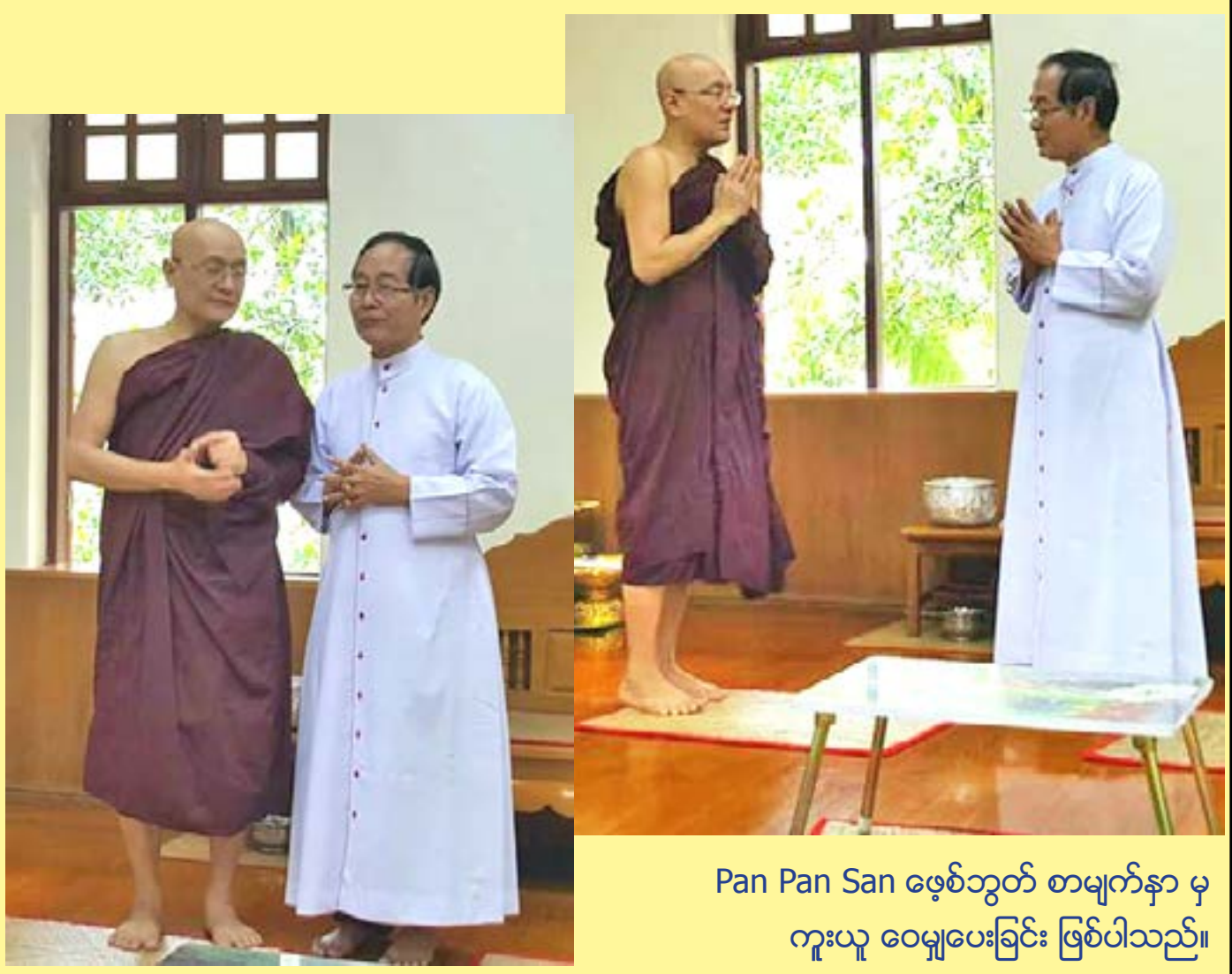
Pan Pan San ဖေ့စ်ဘွတ် စာမျက်နှာ မှ ကူးယူ ဝေမျှပေးခြင်း ဖြစ်ပါသည်။

၁၄ ၇ ၂၀၁၇ နေ့ တောင်ကလေးဆရာတော် ဘုရားအရှင်ပညာသာမိ (တောမိုရဟန်း) ၏ ၅၇ နှစ်မြောက် ဝိဇာတ (မွေးနေ့) မှာ ကရင်ပြည်နယ် ဘားအံမြို့ ရိုမင်ကက်သလစ် ဆရာတော် လာရောက်ဆုတောင်း ဂါရဝလာပြုစဉ် တစ်ဦးနှင့်တစ်ဦး အစဉ်အဆက် ချစ်ကြည်ရင်နှီးခဲ့ကြသော တောင်ကလေးဆရာတော် နှင့် ရိုမင်ကက်သလစ် သာသနာတော် "ဘာသာဝါဒ မတူကြလည်း မေတ္တာစိတ်ဓာတ် အေးမြကြလျှင် တူမျှ ကြလျှင် လောက အတွက်ကောင်းခြင်းပဲ။" တောင်ကလေးဆရာတော် ၁၄ ၇ ၂၀၁၇ " မေတ္တာ တရားတွေ ပွားများနိုင်ပါစေ"