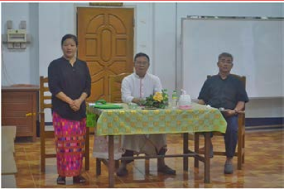
ဂိုဏ်းအုပ်ဆရာတော်ကြီး ဖရန်စစ်က မြစ်ကြီးနားသာသနာ ပညာရေးကော်မရှင် ဒါရိုက်တာအဖြစ် အမျိုးသမီးတစ်ဦးအား ခန့်အပ် စ . . . ၉