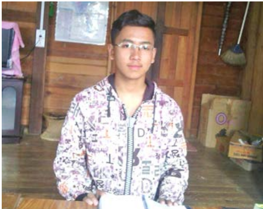
(2017) ငါ့အဖေ့အဖွဲ့မှာ ငါ့အဖေပါ။ အဖေ့အဖွဲ့မှာ ငါ့အဖေပါ။ စ . . . ၁၃

ကိုလန်ဘီယာနိုင်ငံသား ဓမ္မအာဇာနည်များအား သူတော်မြတ်အဖြစ် တင်မြောက်မည် စ . . . ၄