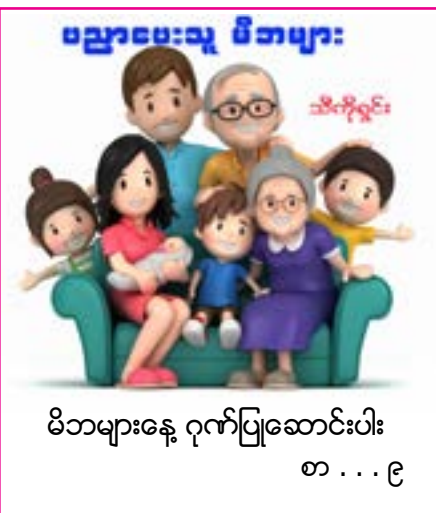
မိဘများနေ့ ဂုဏ်ပြုဆောင်းပါး စ . . . ၉