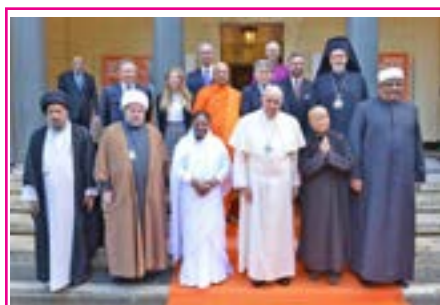
ဘာသာရေးခေါင်းဆောင်များသည် အကြမ်းဖက်မှုကို ကာကွယ်ပြီး ပါရမီများကို တိုးပွားစေနိုင်သည် စ . . . ၆

ကျွန်ုပ်တို့အား လက်နက်များ ဖျက်သိမ်းရေး ဆရာတော်ကြီးများ အဆိုပြု စ . . . ၆